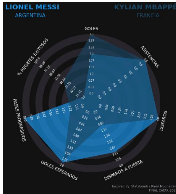
Estadísticas Lionel Messi y Kylian Mbappé en la final de Catar 2022

Mbappé superó a Messi en cuanto a goles marcados y fue más desbordante que Messi, ya que intentó y regateó exitosamente en más ocasiones. Por el contrario, el astro argentino asumió un rol más creador de juego y únicamente intentó en dos ocasiones regatear a un rival. Messi fue más influyente en el juego de su equipo realizando un total de 10 pases progresivos por 2 de Kylian, y disparando a puerta en 3 de sus 4 disparos. El francés anotó 3 goles, pero exceptuando los goles de penalti, únicamente disparó a puerta en su segundo gol. Ambos anotaron en la tanda de penaltis, pero finalmente, argentina se llevó el campeonato.